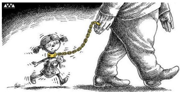
کاریکاتور از مانا نیستانی