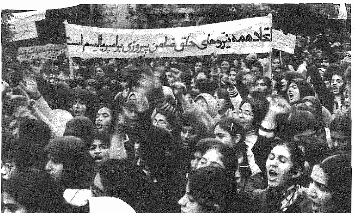
این گوشه ای از لشکر زنان است. آنها مثل همه خلق یک شعار دارند: «مردک بر آمریکا!»