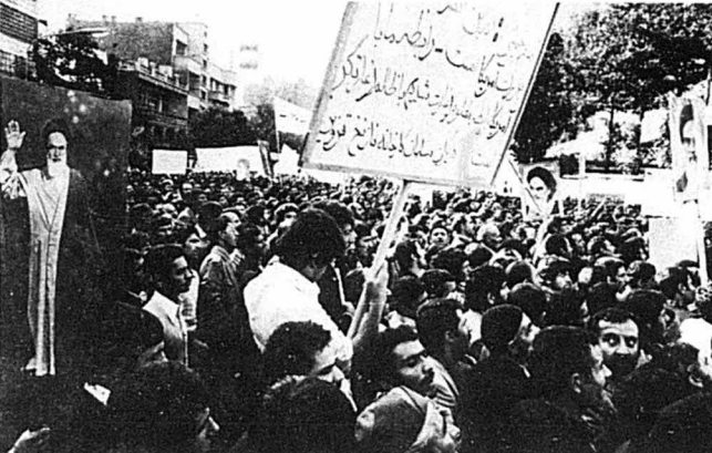
گردان های توفنده کارگران فرمان ایران باره پیمانی های بخرش خوش بسوی لانه جاسوسی امریکا، به نبرد بی امان و بیگوشان بر علیه امپریالیسم خونخوار امریکاداه میباشند.

کارکنان نفت شعار می دادند: - آمریکا را شکستیم، خمینی شیرهای نفتو بستیم، خمینی