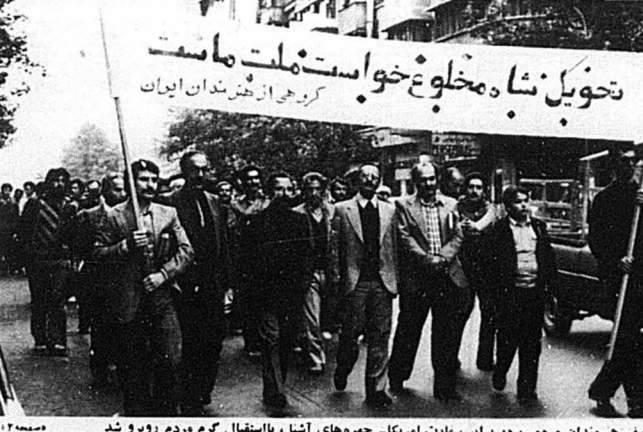
صف هنرمندان مردمی، در برابر سفارت امریکا - چهره های آشنا، با استقبال گرم مردم زبور شد