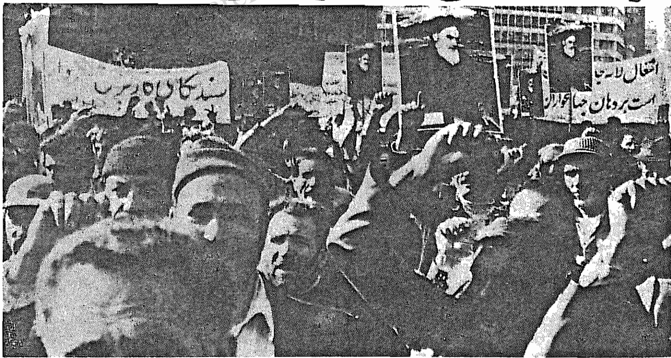
تظاهرات کارگران و زحمتکشان در برابر جاسوسخانه آمریکا پایان ناپذیر است