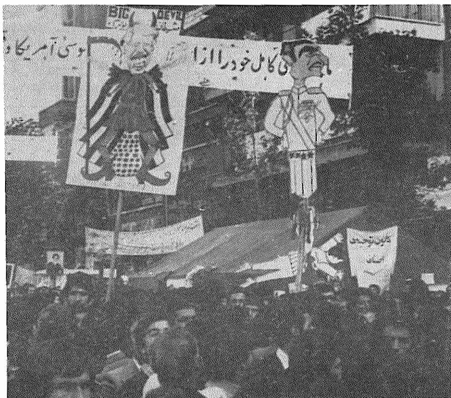
امواج پایان ناپذیر خلقی که علیه امپریالیسم آمریکا بها خاسته است.