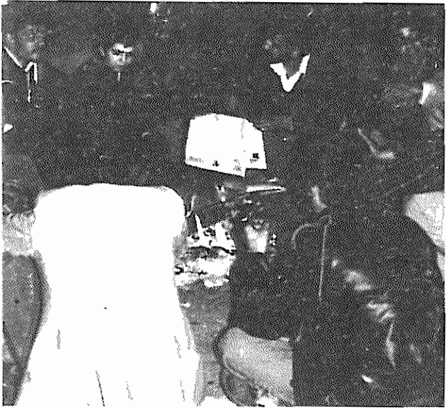
حلقه‌ای برگرد خرم‌ن آتش یکی از صدها جمع ضد امپریالیستی که شب‌ها در مقابل لانه جاسوسی آمریکا گرد می‌آیند.

او کتابی را در باره کار کردن با اسلحه می‌فروشد. بازار مکاره‌ای است که در آن هر نوع جنس خلقی فراوان است دختر می‌آید و بانگ می‌زند: — مردم! جوانی «آذرخش» میخواند. پس بالای‌ش تیر در دست «سند جنایات آمریکا»