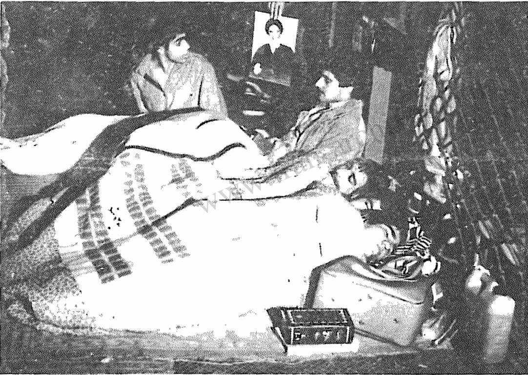
یاران انقلابی، شب را در مقابل جاسوسخانه دشمن سحرمی کنند. از این شب خفتگان بیدار بسیارند.