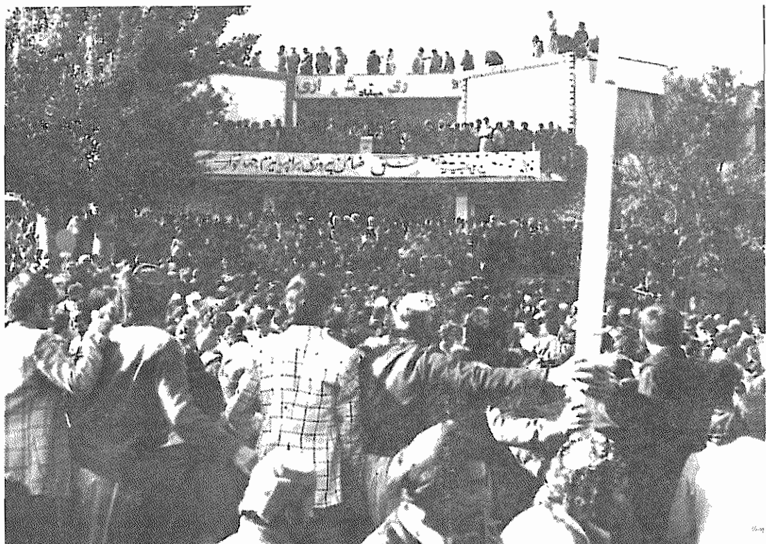
خلق کرد همراه سایر خلقهای ایران با امپریالیسم امریکا می‌رزمد صحنه‌ای از تظاهرات مردم مهاباد در روز ۳۰ آبان

سیر تحول مذاکرات مربوط به حل مسأله آذربایجان در استان آرسوی نیروهای راستین انقلاب، از جانب بسیاری از مجالس اجتماعی و سیاسی باخوبی استقبال شده است. زمینه اصلی این تحول امیدبخش رایج‌ترین رهبر انقلاب، امام خمینی، تشکیل داد و سبب شد که طرفین مذاکرات گام مثبتی در هوار کردن راه حل سیاسی و مسالمت‌آمیز بردارند. بویژه در شرایط کنونی که امریالیسم امریکا از هیچگونه توطئه و دسیسه‌ای علیه ایران (چه در داخل کشور بوسیله ضدانقلاب و چه در خارج کشور استفاده از موقعیت جهانی‌اش) خودداری نکند، جای هیچ تردیدی نیست که هرگونه اختلال و خرابکاری در حل مسأله آذربایجان در استان، بپرعتوان و از هر طرف که باشد، فقط و فقط به نفع دشمنان خلق ایران و انقلاب پیروزمند آنست. با وجود این، در آذربایجان، توجیه‌ها و سوء تفاهات در میان، افراد «کومه» با همکاری و غیراقتصادی و غیراقتصادی، به تلامت مخالفت، باز در خیابانها تظاهراتی پراخ زفت تولید می‌شود. این تظاهرات علیه خط مشی اصولی و انقلابی حزب توده ماست. این در مسأله کارخانهای که در استان در دست دشمنان گردانده شده است.