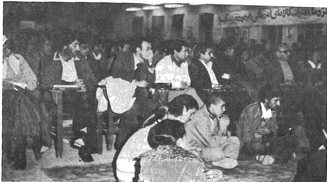
گوشه ای از مراسم یادبود شهدای ۱۶ آذر در اراک

ما از مقامات مسئول و بیوزنه هیئت ویژه کردستان نیز می طلبیم که جلوی این تحریکات را، که هدفی جز عقیم گذاشتن مذاکرات کردستان و جلوگیری از حل مسالمت آمیز مسئله کردستان ندارد، با قاطعیت بگیرند.