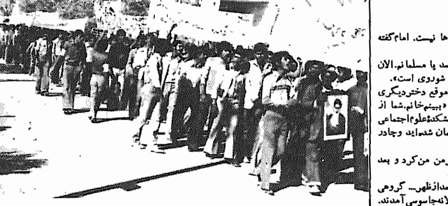
صحنه ای از تظاهرات اهالی «اوز» علیه امپریالیسم آمریکا در اول محرم

در راهپیمایی گروه کبیری از اهالی اوز استان از توابع شیراز، که بمناسبت اول محرم سال ۱۴۰۰ قمری به پیروی و تأیید خط امام خمینی برگزار کردید، شرکت کنندگان تهدیدهای های نظامی و اقتصادی امپریالیسم آمریکا را محکوم کردند و پشتیبانی خود را از اشغال جاسوسی خانه آمریکا بدست دانشجویان مسلمان پیرو خط امام ابراز نمودند. در پایان راهپیمایی قلمنامه ای در پنج ماده شرح زیر با تاسف آراء بصوب رسیده: ۱- قطع کامل روابط سیاسی، اقتصادی، نظامی و فرهنگی با امپریالیسم آمریکا. ۲- استرداد شاه، خان، فراری و مخلوع همراه با دیگر جنایتکاران فراری و بازگشت کلیه اموال و داراییهای تکیه توسط خائیز از ایران خارج شده است. ۳- مصادره و ملی کردن کلیه اموال، داراییها و بانکهای آمریکایی در ایران به نفع زحمتکاران وابسته به آمریکا و ضدانقلاب. ۴- پاکسازی ادارات و سازمانها از عوامل و وابسته به آمریکا و ضدانقلاب. ۵- محاکمه همه بازماندگان ساواک و جنایتکاران ارتشی و همچنین ایدئولوژیستگاه حاکم پشیمان.