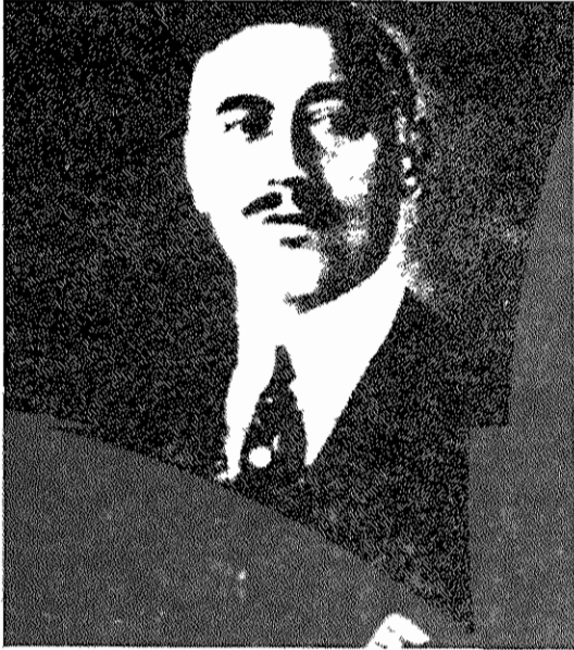
حیدر خان عمواوغلی - ۱۲۵۸ - ۱۳۰۰ هجری - ۱۳۰۰ صفحه ۷

بمناسبت صدمین سالگرد تولد انقلابی بزرگ حیدر خان عمواوغلی