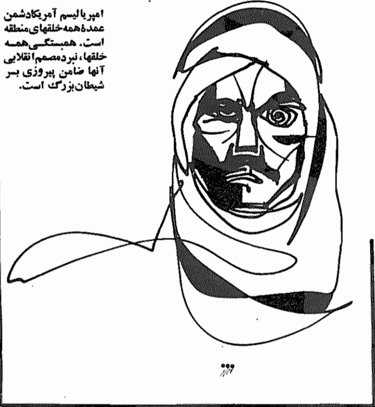
امپریالیسم آمریکادشمن عمده همه خلقهای منطقه است. همبستگی همه خلقها، نیرومستقیم انقلابی آنها ضامن پیروزی بر شیطان بزرگ است.

ما به وزارت خارجه و مقامات مشغول پیشنهاد میکنیم که از این امکانات نیز در کنار سایر تدابیر بهره گیری کنند، تا بگفته امام، آمریکای گز نتواند هیچ غلطی بکند و همبستگی خلقهای مستضعف منطقه علیه شیطان بزرگ در این مورد مشخص و مهم متجلی گردد.