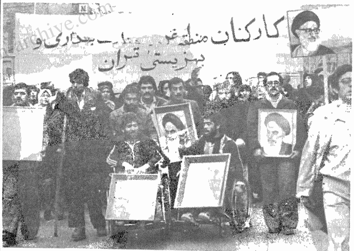
تظاهر کنندگان امروز فریاد میزدند: سرتاسر این دنیا، فریادها یکی شد، ای مرگ بر آمریکا،

بامبارنه ضد امپریالیستی امام اعلام داشتند. در پایان یکی از کارکنان بیداری و بهزیستی قطعنامه کارکنان این سازمان را قرائت کرد. در این قطعنامه بعد از تأیید بیکرانه رهبری امام، از دانشجویان مسلمان پیرو خط امام خواستار ادامه افشاگری شدند. همچنین در این قطعنامه آمده است: