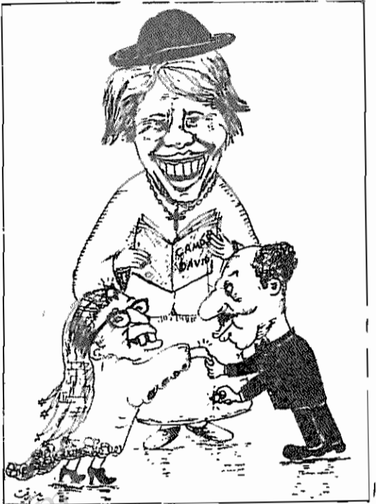
آزادگان - ۸ بهمن ماه ۱۳۵۸

(بامداد ۸ بهمن) و اما درباره پناهندگان مسجدالحرام، خالد بکتاش می گوید: صالح سعید، رهبر جنبش آزادی بخش عربستان سعودی چندی قبل در بیروت گفت: آنها برای آزادی و علیه رژیم ملک خالد نبرد می کردند و بمسجدالحرام پناهنده شدند. (املاطیان، ۸ بهمن)