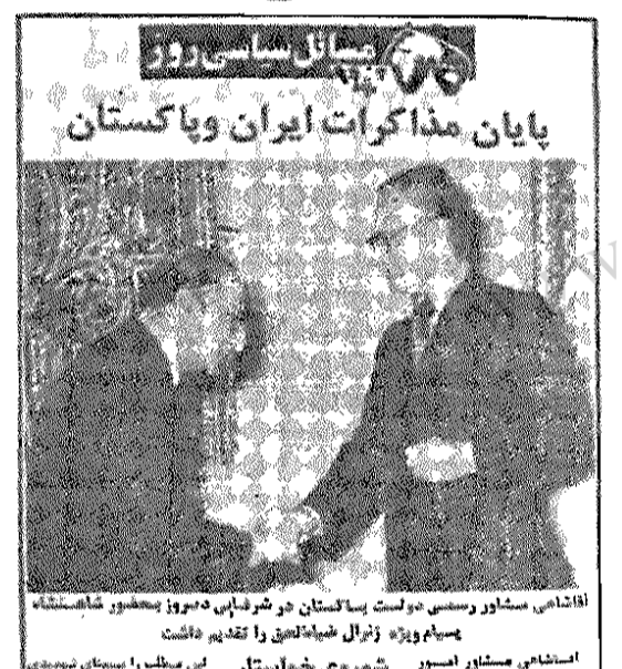
پایان مذاکرات ایران و پاکستان