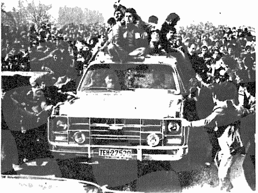
بختیار اعلام کرده «فرودگاه مهرآباد امروز باز خواهد شد و هیچ مانعی برای بازگشت آیتالهمخینی بعمل نخواهد آمد» (اطلاعات، ۹ بهمن ۵۷)

وآن روز، امسال یک ساله تاریخ داده شده است: