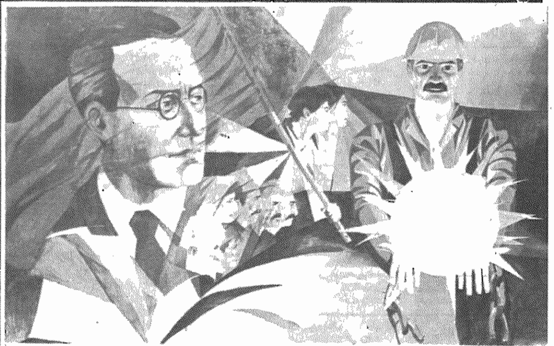
یکی از آثار شهاب موسوی‌زاده در نمایشگاه ارانی

جاسوس‌های آمریکائی در زیر چشم وزارت خارجه از ایران فرار کردند! شش جاسوس آمریکائی، با تهران، از ایران می‌گریزند. پاسورتهای جعلی، که به مهر جو کلارک، نخست‌وزیر کانادا، جعلی گذرانده و عبور مرموز سپس رسماً این عمل را تأیید بوده‌اند، به کمک سفارت کانادا در می‌کند و آنرا از اختفارات.