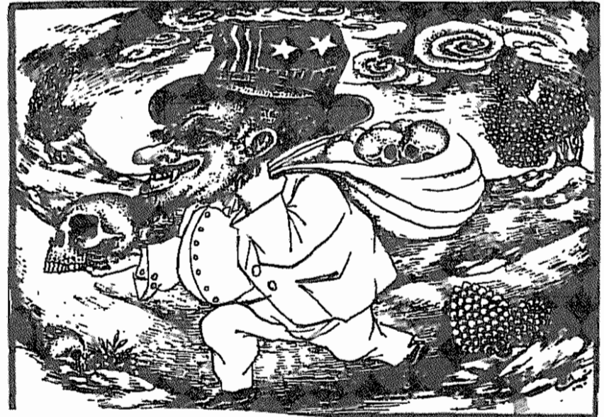
جمهوری اسلامی - اول بهمن ماه ۱۳۵۸

آیا وزارت خارجه ایران در کنار آمریکا، چین، پاکستان و اسرائیل فریاد واسلاما بر نیاورده و در راه رواج اسلام آمریکائی گام نگذاشته است؟