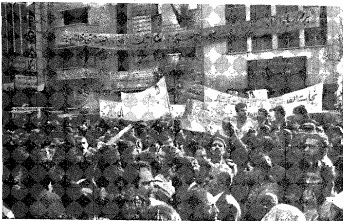
دهها هزار تن از مردم پس از پایان نماز جمعه به مقابل لانه جاسوسی آمریکا رفته و پشتیبانی خود را از دانشجویان مسلمان پیر و خط امام اعلام کردند.

دیروز بعد از ظهر، هزاران نفر از نمازگزاران روزجمعه، پس از اجرای مراسم نماز، برای پشتیبانی از دانشجویان مسلمان پیر و خط امام و آیت‌الله خلیلی، دست به یک راهپیمایی زدند. نظام‌کنندگان که از دانشگاه تهران به طرف لانه جاسوسی در چندین گروه راهپیمایی میکردند، شمارمی‌دادند، دانشجویی خط امام، افتخار کن، افتخار کن