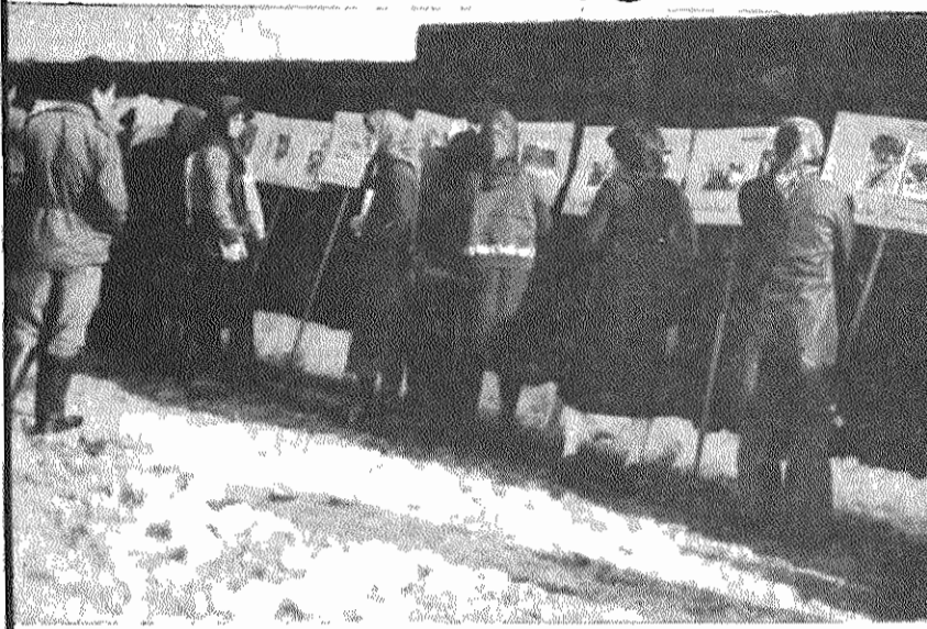
اعضاء و هواداران حزب توده ایران در آبکنار، نمایشگاه عکس از جنایات امپریالیسم پس کردگی امپریالیسم آمریکا را بطور سیار در نقاط مختلف آبکنار برپا کردند، که مورد استقبال پرشور کشاورزان، بازاریان، دانش آموزان قرار گرفت. در این نمایشگاه جنایات امپریالیسم در ایران، ویتنام، کوبا، شیلی، نیکاراگوئه و... برای روستائیان ناشی گردید.