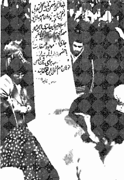
این طوماری است که صدها هزار تن از نمازگزاران دیروز به پشتیبانی از عمل انقلابی دانشجویان مسلمان پیر و خط امام و درخواست افشای اسناد بدست آمده، آنرا امضاء کردند