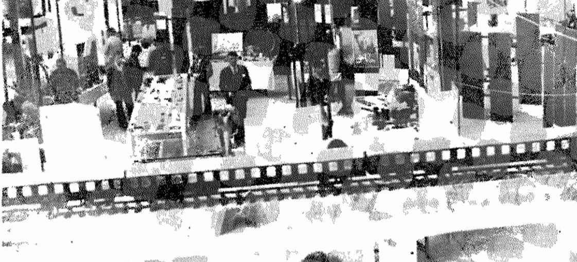
گروهی از نمایشگاه لوازم یدکی راه‌آهن

در روز اول برپایی نمایشگاه، ۵۰۰ صنعتگر ایرانی آمادگی خود را برای ساختن ۱۰۰۰ قطعه لوازم یدکی اعلام کرده‌اند.