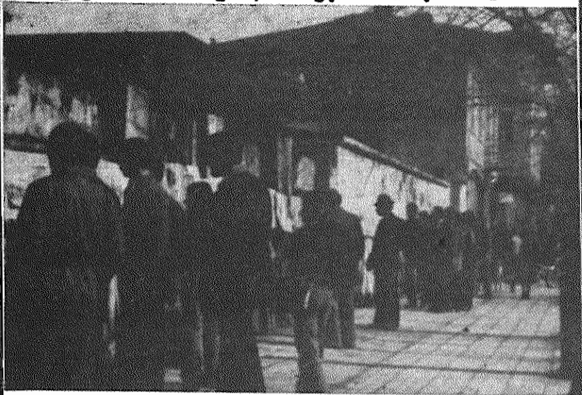
نمایشگاهی از جنایات امپریالیسم آمریکا علیه خلق های جهان توسط جوانان هوادار حزب توده ایران در بندر اتزلی برپا شد. این نمایشگاه که به مدت ۳ روز ادامه داشت، با استقبال مردم بندر اتزلی مواجه گشت.