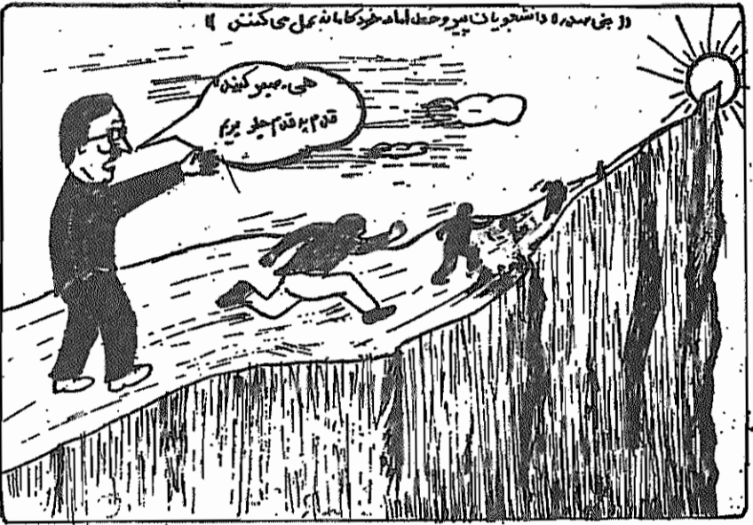
(آزادگان، ۱۸ بهمن ۵۸)