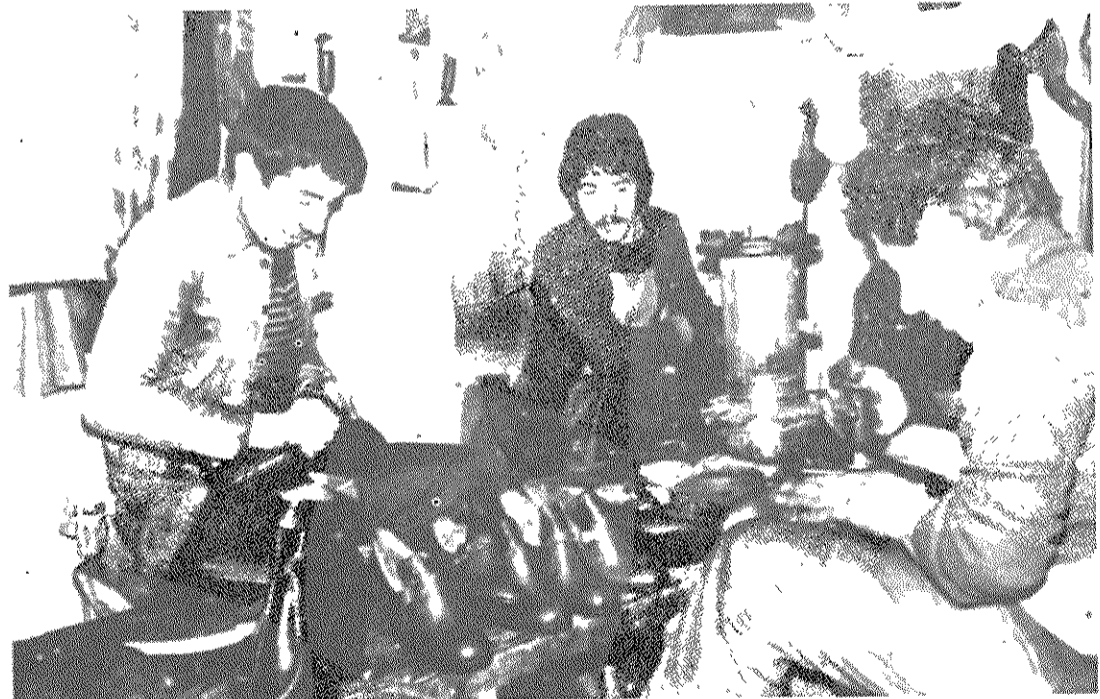
روزی ۱۷ ساعت کار در بدترین شرایط

انقلاب می تواند و باید به کارگران ایران و از جمله کارگران کفاشی امکان زندگی بهتر بدهد. کارگرانی که با تمام رنج و محرومیت بخاطر پیروزی کامل انقلاب، فریاد عظیمشان را در گلو فرو خورده اند.