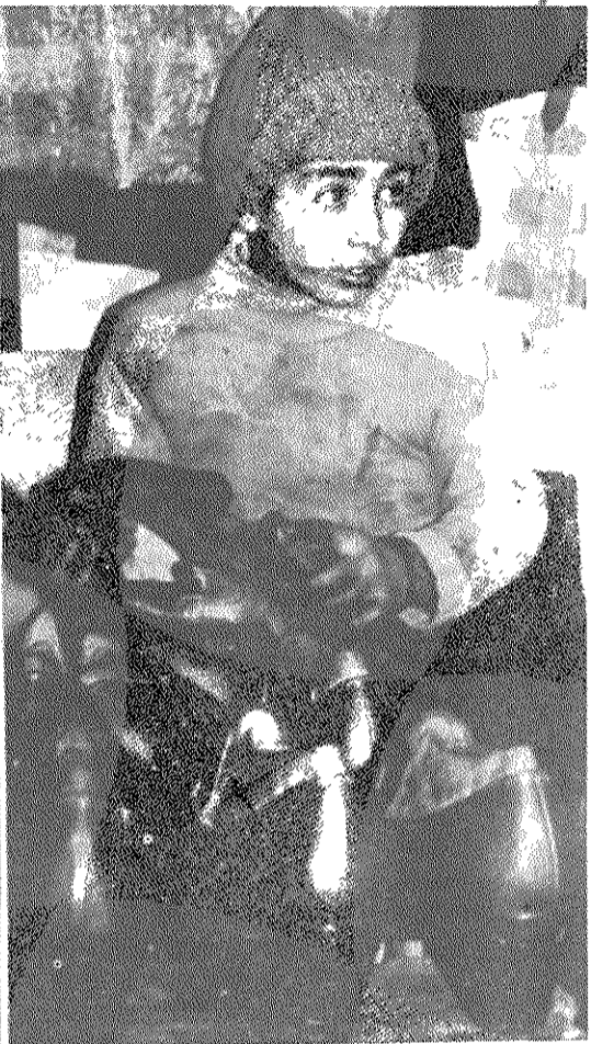
۱۲ سال دارد. روزی ۱۶ ساعت کار میکند و خرج ۸ تومانی را باید بدهد

آیا وقت آن نرسیده که تکی به حال این عزیزان، این گرانیها ترین سرمایه کشورمان بکنیم؟ آیا وقت آن نرسیده که تمام این اربابهای شوم خانواده این خانم پهلوی را محروم و نابود کنیم؟ اربابهای که انسان را چنین به کار رنج بازمحکوم کرده است؟ نرسد، از این رنج می گوید.