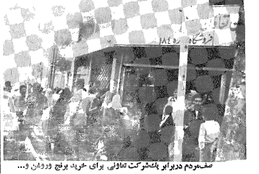
صف مردم در برابر شرکت تعاونی برای خرید برنج و روغن ...

کارگران خردسال کفاشی های تبریز: انقلاب! ما را از استعمار نجات بده... پانزده هزار کارگر کفاش در کارگاههای کفاشی تبریز، در سخت ترین شرایط رنج میبرند و کار و بیکار میکنند