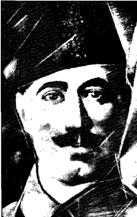
حیدر عموآوغلی، رهبر برجسته حزب کمونیست ایران

نحو یا بدان نحو، تحت تأثیر عمیق شیوه تفکر، تحلیل و حتی اصطلاحات حزب کمونیست ایسران قرار گرفت.