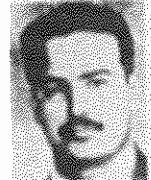
به یاد دهمین سالگرد شهادت رفیق بیژن جزنی و همزمان

پس بست سیاست فدملی و جنايتکارانه رژیم در ساله جنگ، همانگونه که انتظار می‌رفت، گریبان آن را به تمام و کمال گرفته است. شکست عملیات جنايتکارانه و عمیقاً فاجعه‌میزید و قربانی شدن حدود ۳۰ هزار نفر از زحمتکشان میهن ما در بقیه در صفحه ۲