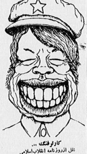
کارتون فلک ...

باید همه ما بدانیم که اگر در صحنه نبرد اقتصادی شکست بخوریم، نه تنها انقلاب اسلامی، بلکه کشور را از دست خواهیم داد. مردم - ما به امپریالیسم خونخوار آمریکا، غارتگری و تجاوزکاری است. اگر ریشه های نفوذ امپریالیسم را قطع نکنیم، این کشور در فشار و طرز تلقی خود را نسبت به ایران، بنوعی یک قدرت فائق و قائم نموده، چون چنین سیاسی بهیچ وجه از نظر ما قابل قبول نیست. آمریکا باید علما نشان دهد که قصد مداخله در امور داخلی کشورهای دیگر را ندارد. ما ما یلیم با تمام کشورهای اوپا و دوستانه داشته باشیم. روابط باید بر پایه احترام متقابل و بر اساس تساوی و منافع مشترک طرفین استوار باشد. آمریکا باید امنیت های جدید ایران را بپذیرد و سر کند آنرا درک نماید - آمریکا باید فکری در خالت در امور داخلی مملکت را از سر بردارد.