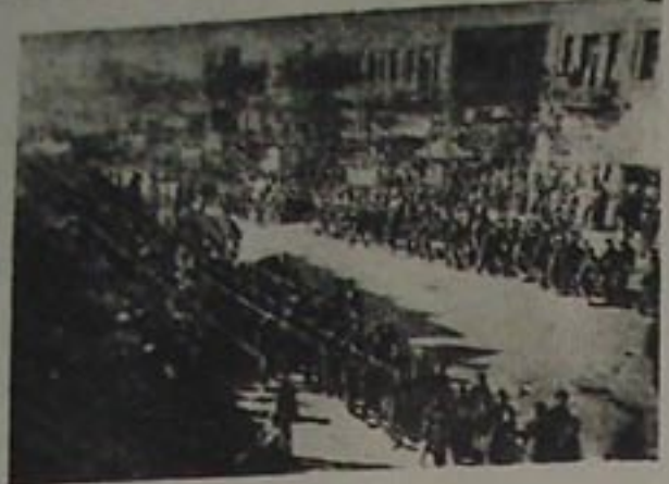
فرقه کنکره سینی تبریک ایدن دسته لردن بیر منظره