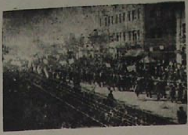
کنکره مره تبریکه کمدن حما عتدن بر دسته