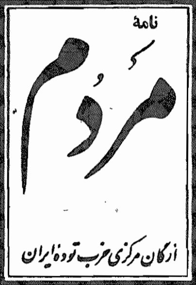
دوره هفتم، سال دوم، شماره ۲۲۲ سهشنبه ۱۹ دیهشت ۱۳۵۹ - تک شماره ۱۵ ریال