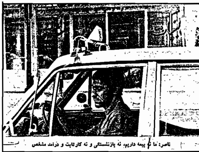
ناصر: ما تا نیمه داریم، نه تا زشتی و نه کار لابت و درآمد مشخص

مشکل تاکسیرانی یکی از مسائل - عمده‌ای است که در شهر خرم آباد وجود دارد. این شهر، حدود ۳۰۰ تاکسی دارد، که با توجه به جمعیت شهر، نادره تا به این روزهاست و آمدن یک تاکسی جدید به آنجا دشوار است. با توجه به وضعیت اقتصادی و درآمد کم، تاکسیرانان با مشکلات فراوانی مواجه هستند. هزینه‌های تعمیرات و تعویض رنگ تاکسی، که گاهی تا ۱۰۰ هزار تومان می‌رسد، برای بسیاری از آنها یک باره شده است. با توجه به این شرایط، تاکسیرانان خواهان تعویض رنگ تاکسی به رنگ سبز و آبی هستند، که هزینه کمتری دارد و همچنین در بار باره تعویض رنگ آن آسان‌تر است.