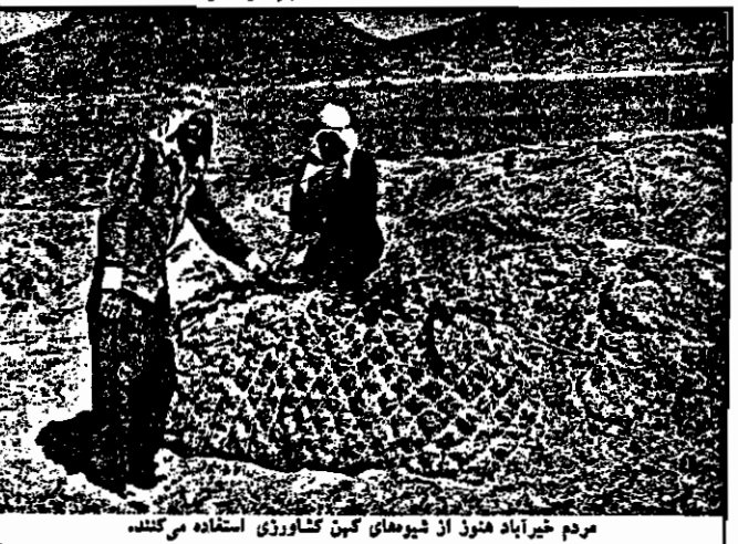
مردم خیرآباد هنوز از شیوه های کهن کشاورزی استفاده می کنند.

در باره کردستان نباید بر اساس ذهنیات و با اغیار دروغ بدخواهان تصدیق کرد، بلکه بر اساس واقعات موجود باید با صفا کردستان را حل نمود. با حال مسالمت آمیز مسئله کردستان، با تکیه بر پیام تاریخی امام خمینی، ستم ملی را از دست مردم این دیار بردارید! با برقراری صلح در کردستان، به مردم امکان شکوفایی و رشد دهد! با اجرای سریع و یکسر قانون اصلاحات ارضی سوسود دهقانان نه بدست، رنده نفاذ و ستم بزرگ مالکی را برکشد و انقلاب را مستحکم و شکوفا سازد!