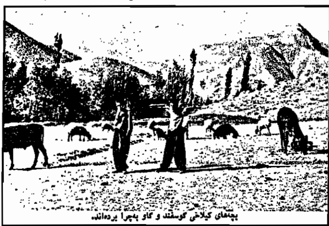
پشمای کلبائی گوسفند و گاو پشرا پرده اند.

روستاهای کردنشین سالها مرصه ظلم و تجاوز به دهقانان و سرکوب خواستهای یقین آنان بوده است. انقلاب باید بتواند با شکست گزینی اقتصادی و فرهنگی و ملی زحمتکشان کرد باشد. طرد بزرگ مالکان و فتوالد ها، ایجاد شرایط برای رشد و نمو اقتصاد و تکامل فرهنگ ملی روستائیان کرده و وظیفه میرم دولت است.