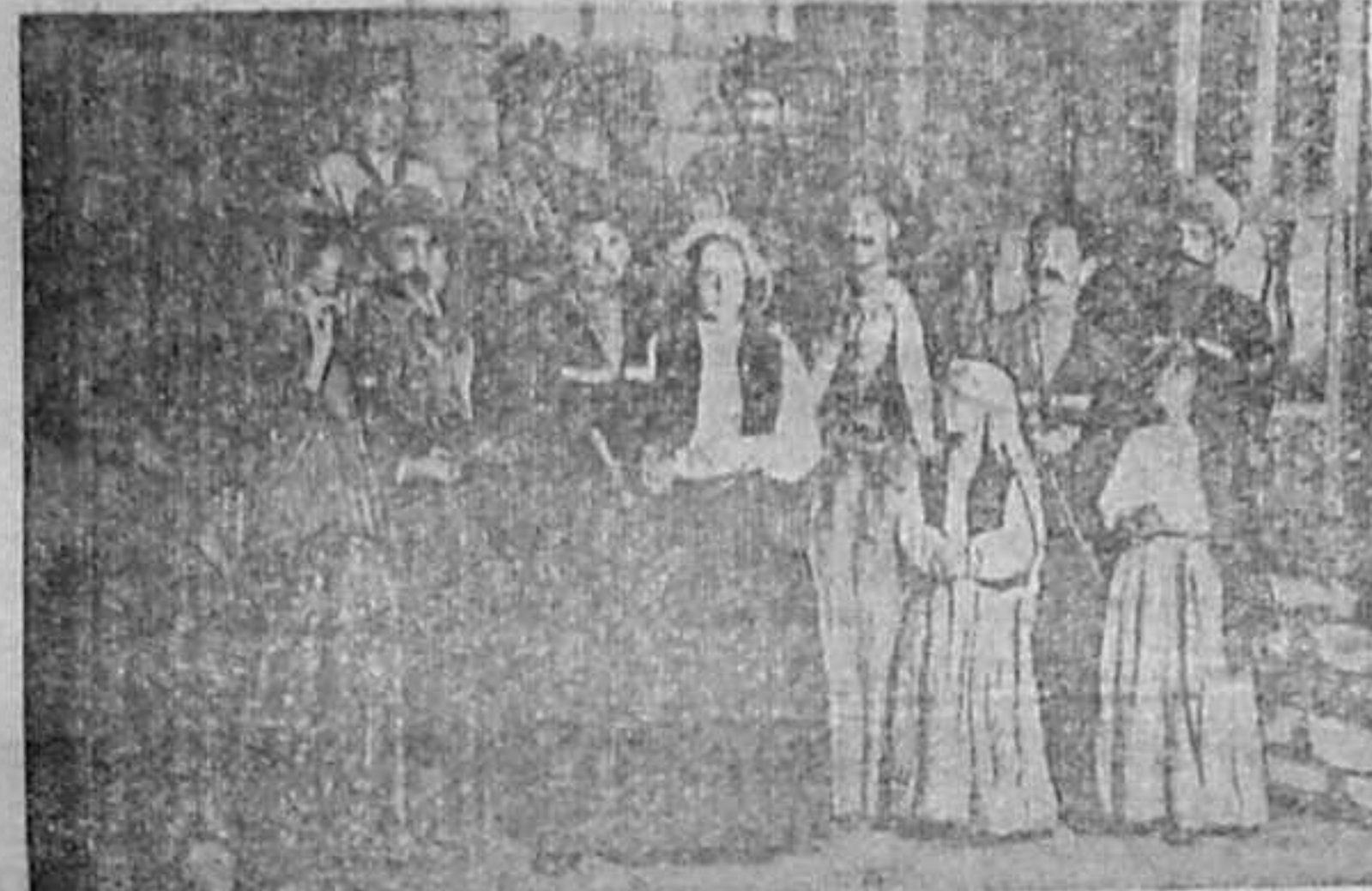
تبریز تئاتر و سینما تماشاها قویولان «لاموس» دراماسندان قوی پرده سی

را با اشتراک خود در مقام فرماندهی آنها قوت و زینت دهید و خاطر جمع باشید در ارتش نوین ما تمام درجات و سوانق خدمت تمام شما ها محفوظ خواهد ماند، دیگر در ارتش ما نیروی اهریمنی ارتجاع نیست که شما را از خدمت بایران و آذربایجان خود مختار دل سرد نماید: رفقا بدانید ارتجاع تهران دندانها را تیز کرده و در پی فرصت میگردد که شما اولاد خلف آذربایجان را در اولین فرصت از پای در آورد آگاه باشید خود را بدام نیندازید آنها تبعید گاهها و باز داشتگاهها در جنوب برای شما حاضر کرده اند تا محض رسیدن به تهران شما را تحت الحفظ مثل سایر رفقای تان به آنجا بفرستند. ای پسران آذربایجان ای اولاد آذرها ما از شما انتظارات بیحد و حصری داریم با الحاق تان ارتش مالیات تانرا ورشد و نمو حس آزادیخواهی تانرا بجها نیان ثابت نمائید تا همه بدانند ما زنده ایم و هرگز برده دیگران نخواهیم شد: مادر وطن شمارا با مداد میخواند زنده باد حکومت ملی و خود مختار ما: زنده باد ارتش ملی ما که افسران جوان وطن پرست آذربایجانی فرمان دهان نامی آنها خواهند بود، (کنده ای)