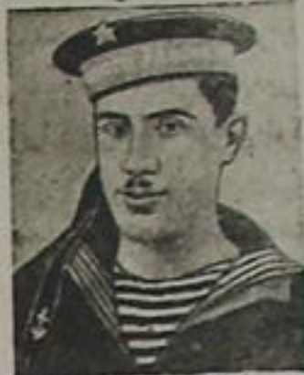
سووت اتفاقی قهرمانی شئور محمد اوفی

انسانیت ، مدنیت و صلاحی اورواق ایجون داشیدیمی بوپوک ایده آل و هدف دن آسیلی ایدی .