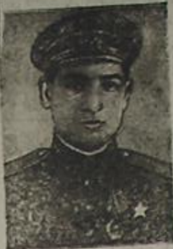
سووت اتفاقی قهرمانی میکائیل محرموف

چونکہ فرانسه نین ده بوتون اروپا قولکه لری و خلقلری کیمی مقدراتی ستالینگرادا و قزیل اوردو نون سلاح گوجی و قهرمانلیقی سایه سینده تعیین ایدیلیمیشدر .