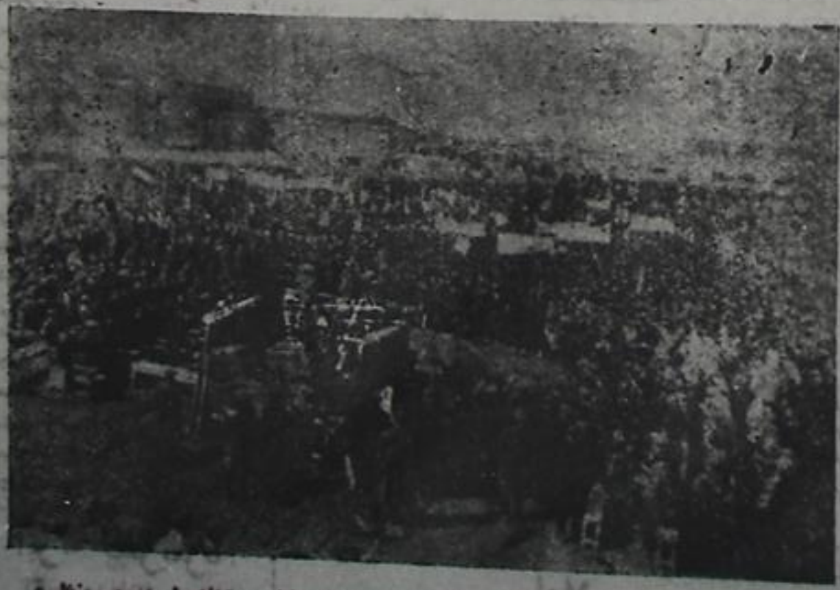
ملی قوشون چاغیریشی مناسبتیه نولکه مبرده تفکیک تابان میتیک لر دن بیر منظره

تماشا اولونور نوز مقاله لرینی آشکار خط ایله یازیب واضح امضا ایتدیکن سوزا اداره به گوتنه رسینلر.