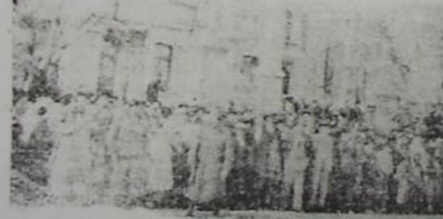
رسمی کتیبه تماشا ایدرلرین ایکی منظره