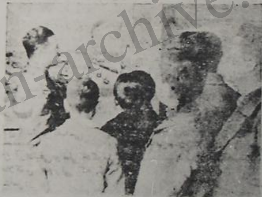
تبریز عکسلی لری سرگییه تماشا ایدرکن