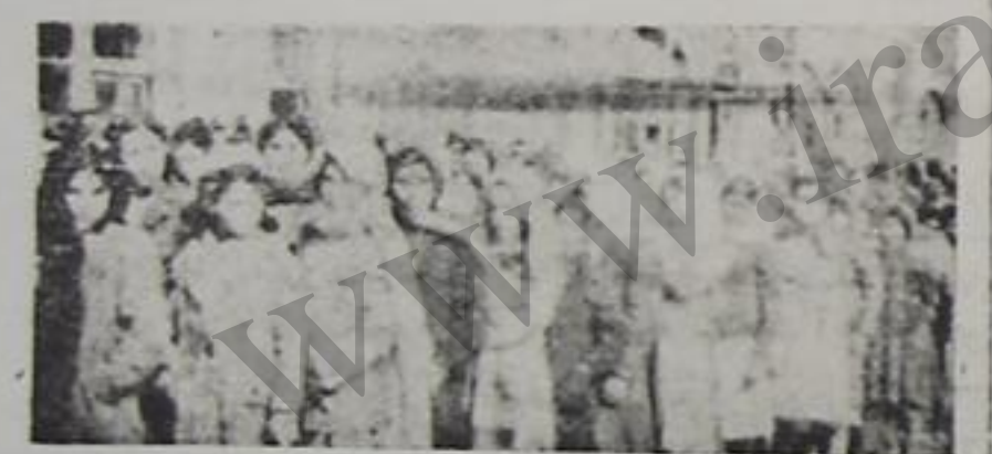
رسمی کتیبه ده ایتدی بئش قزیل اوردونو