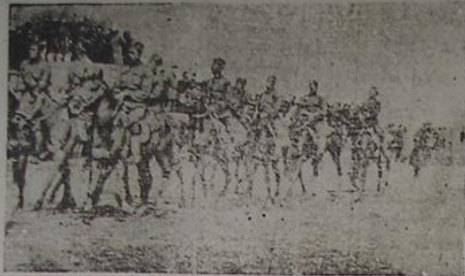
حاج قوشونلاریه زین آنلی دستلریندن

ایندی ارتجاع منگه سیندن فورقلموش ملتیز هر ساحده ترفی و انکشافه دوغری گیتدیگی کیمی