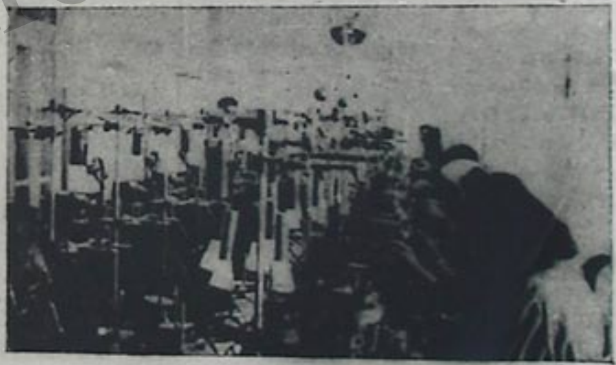
نوخوجولوق کارخانه مینین ماهبلاریندان بیر نمونه