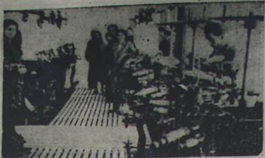
نوخوجولوق کارخانه مینین داخلی منظره سی

اینگی صحنه دن بیه بووک بیر صنعتکاری، روس بدیی ده آکیز، بین پارادیمی سی اولدو. عونی پارلاق بیر صورتده گوستر. میسره، هار، بو اثر اوزمیشده. ۷ ایل ایشلمیش در. [۱۸۳۳ نیسی ایلمده باهلامیش ۱۸۳۱ نیسی ایلمده پیتریش در] برینی روماندا هار، ماسر روس حیاتیین زنگین سحنلرینی، دیو- وریان عادت و عسقلرینی بووک بیر صنعتکار لایه تصویر ایشلمیشدر. هار او، زمانکی دیورویان ضیا. لیلارینین معنوی حیاتیسی، مدنی احتیاج و انسرسلرینی درین و گیش بیر صورتده ایلدیر. شاعر بو اثرینده بووک بیر مهارتده تاپما لونه گین، ایسکی کیمی جانی او رازلار پاراهماللا، اولارین بوتون فکرلرینی، معنوی وارلیقلارینی، خویبارلارینی، انکشافلارینی پارلاق بی قلمه گوستریر. اثرده کی زنگین طبیعت تصویرلری، برکک شهر تخیلیسی، دلیتین ساهلیگی، آهنگدار بدیی و اظطالارینین زنگینی، کیمی، حیاش، انقی دوله، یلغی لونی روس پارتیاسینین فروسمینه فالدیردی. پوشگین عسرونون سون ایلمینده پارتیسی (۱۸۳۶) (لایتان قیزی) رومانی اولموشدر. مضمون اعتباریه اثری تاریخی بیر آراسادابوتوتو. که پوشگین باهادیی حیاتیین ان