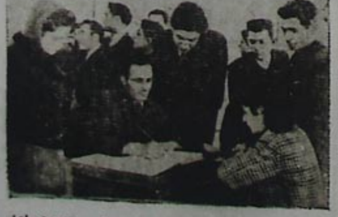
تبریزده مدنیت ایوینده تشکیل اولونموش سرجه تماسا ایندیکندن صورلا تماسا چیلار خاطره دفترینده توز خاطره لرینی قید ایدمیش

اداره میزه و ترهیل مقاله و شعر لر هچوجیه دالی و ترهیله حکمر