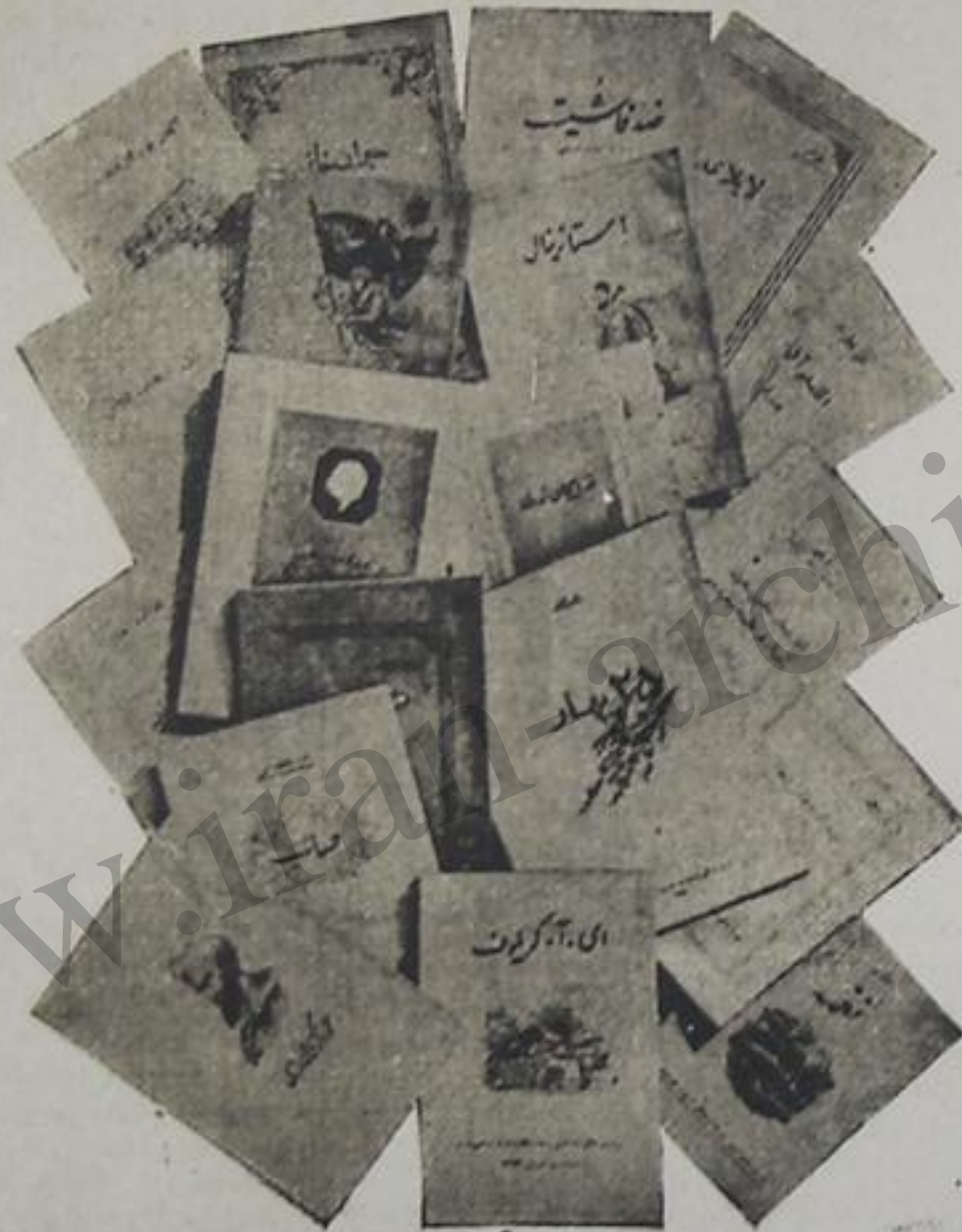
سووهت مدنیت ایوی طرفندن نشر اولان کتابلار

ایوی نشریاتی و سیاسیله خلق بیز سووهت آذربایجاندا وجود گن نیک منشی تربیتاندان، وسیع علمی و ادبی تکمیلدن خبر توله میشدر. سووهت آذربایجانین ۲۵ ایلیک ایتلال چشمد. حرکت ایتن ایرانی عالم واجتماعی مدهترین خاطرلر مجموعه سیه. حصر ایتدیلمیش فرق نامه گوزل و بدیع مجموعه اولدوغی مراهبدر. بو گوزل کتاب بیر وسیع مده. سووهت آذربایجاندا وجود گن اقتصادی، اجتماعی و سیاسی تربیتین یوتون ساحه لری مشاعده چیلر نقطه نظریندن لوغوجور لازا مینا گونترمیر.