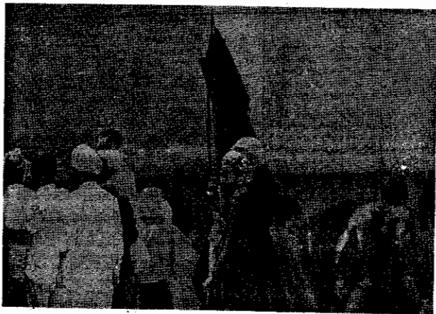
صحنه ای از تظاهرات اخیر مردم عبور قم

زنده باد همبستگی دانشجویان ایران با مبارزات خلق