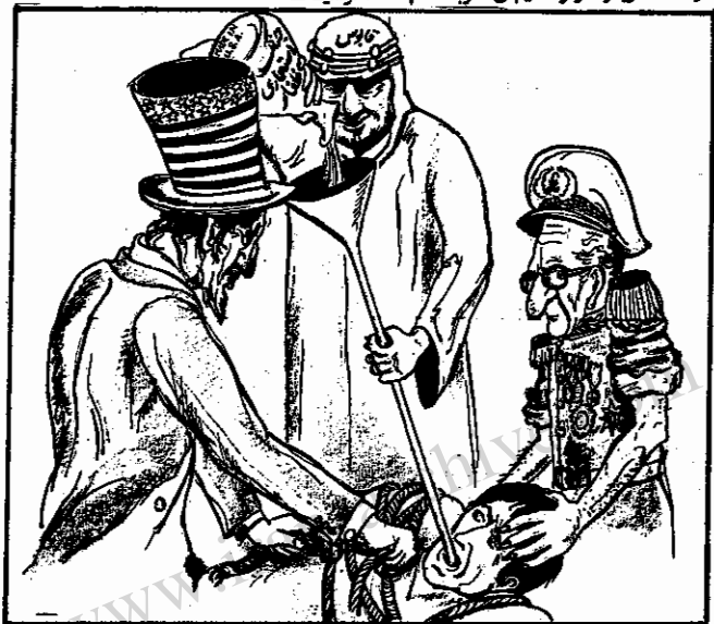
ارتشبد قلامرضا ازهارى و شيس ستاد بزرگ ارتشدا ايران

” در سال گذشته از شجاعان و جانباز نیروهای مسلح ۱۹ نفر ۷۶ درجه دار و ۵۶ سرباز در راه میهن شریعت شهادت نوشیدند ”