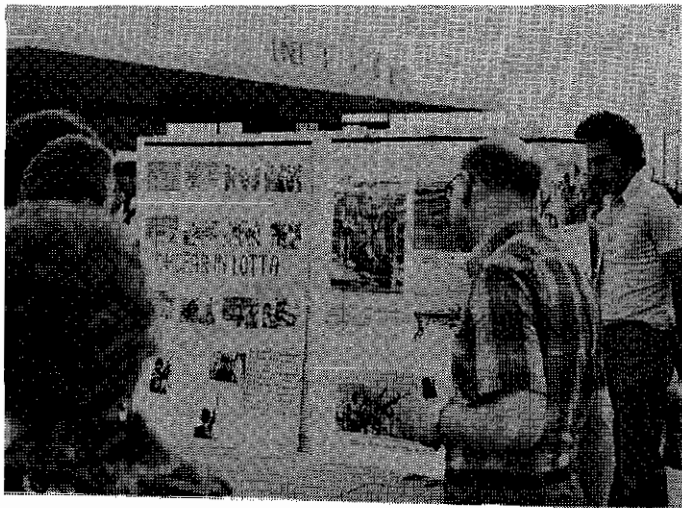
نمایشگاه عکس جوانان و دانشجویان دمکرات در گرنوبل

تشکیل میدادند • جوانان و دانشجویان دمکرات بوسعت به پرده دری از چه سوره فاشیستی شاه و آگاه کردن افکار عمومی از وضع زندانیان سیاسی و جنایت رژیم در باره بقتل رساندن ۹ زندانی سیاسی پرداختند و قریب ۷۰۰ امضاء اعتراضی به این جنایتاً رژیم جمع آوری کردند • آرمان : امضاء های اعتراضی برای کمیسیون حقوق بشر سازمان ملل متحد ارسال شد