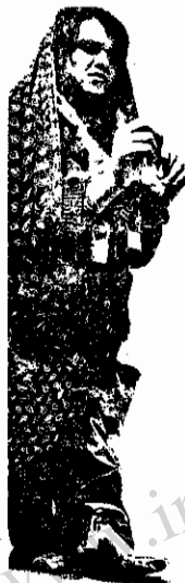
" این زن را پدرش مال و زنجیر کرده است "