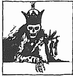
"ره به تهر میره بحسنی به باباشر"