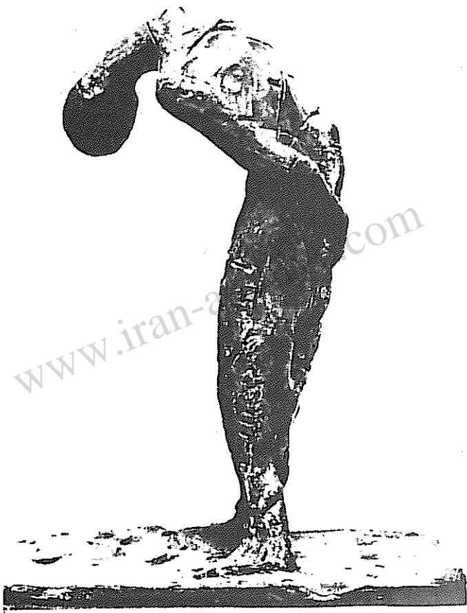
نیر بارن شده کار : استاد رضا اولیا*