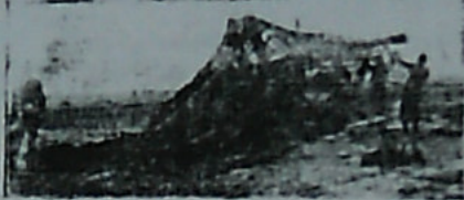
نویسای برای نیروهای حاضر شده

پیش از سه ماهه بود که سپاهان آلمانی و ایتالیایی در میدان حرض ۴۰ میل در مواصلین درونی متزانه و گودال القطاره متوقف بودند و نظماً علت این توقف دو چیز بود. یکی آن که قیصر فرماندهی ارتش متزانه انگلستان موسس طرح فتنه استراژیکی مدعی گردید که با نتیجه نوازش گشته بر طرف گشت. دوم آنکه رومل پس از یک سلسله حلات از لحاظ خوارپرو مہبت و ادوات جنگی در مقبضه افتاد از آفریت تا کون اقلاب های طرفین در این جنبه حاکی از آوازش و با شد اکثر سوارپسای هوایی