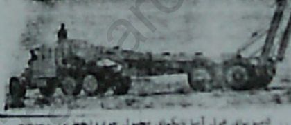
تیمونهای غول آسا سوارپسای معمول خود را در دست

اعلام جابجایی شوروی همان همه اعزام شده ... این مسئله واضح بود که حمله آینده را آغاز شروع حمله کرد که از لحاظ جرات و کفایت جنگی بر حرف برتری داشته باشد. سوارپسای شیده حالت داشت قصد داشته که در این فاصله از زمان نظر ملت را جنبه دیگری معطوف سازند. اما چنانچه بعد از آن نیز تیزه ستک خورد و متعین پس از تهیه های حمله که بوسیله سوارات های شیده که ۲۰۰۰ نفره در راه اجرا