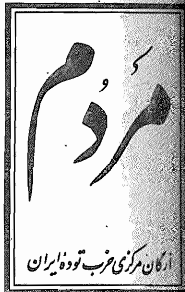
آرگان مرکزی حزب توده ایران

به مخالفان مذاکرات و راه حل سیاسی، بهاهانه ندهیم. اخلاگران در مذاکرات را افشاء و طرد کنیم