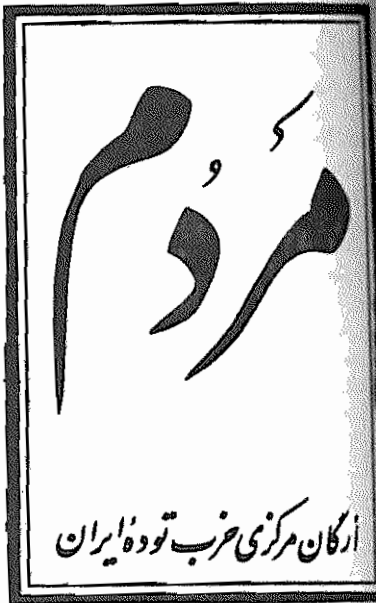
ارگان مرکزی حزب توده ایران

دوره هفتم، سال اول، شماره ۱۱۱ شبه ۱۷ آذر ۱۳۵۸ - ۱۳۵۸ - شماره ۱۰ روال