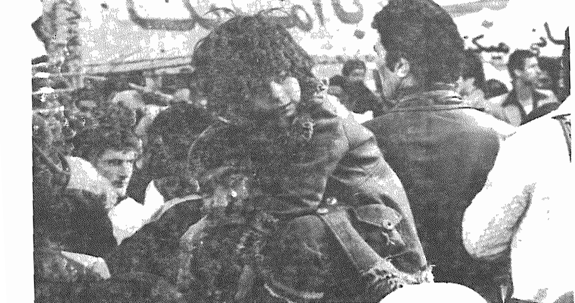
نبرد با امریکا، این دشمن اصلی خلق های ایران و جهان، در سراسر کشور ادامه دارد. همه روزه، گروه های بازهم بیشتری از مردم مبارز وطن ما، از کثافت کشور، خود را به تهران میروسانند و در برابر جاسوسخانه امریکا، دیدارهای باشکوهی با هم دارند.

باید همواره در نظر داشت که خلق کرد و نیز رهبری انقلاب، خواستی جز اتحاد برابر حقوق خلقها ندارند