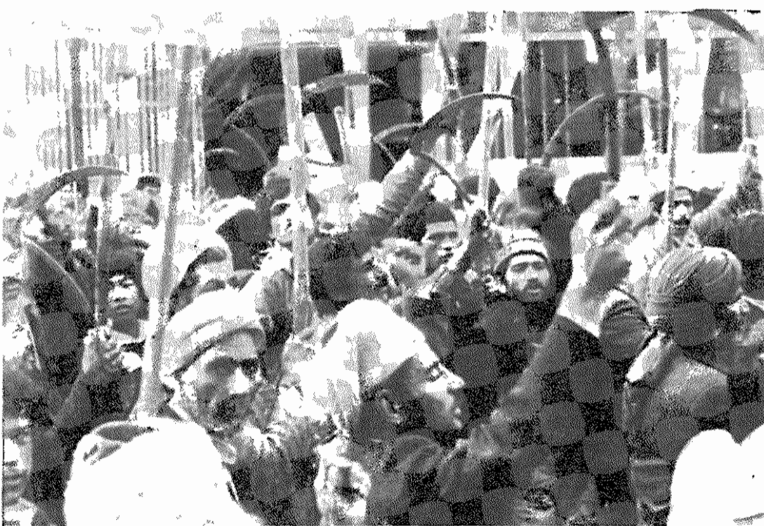
دهقانان زحمتکش خراسان حق خود را میخواهند: زمین و آب.