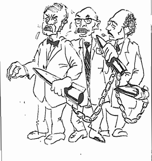
محکوم می کنیم - با خاک یکسان می کنیم - هم محکوم می کنیم هم با خاک یکسان می کنیم