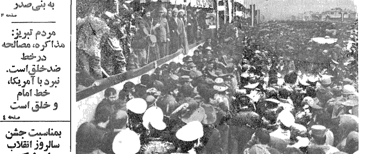
مردم تهران در میدان آزادی، نخستین سالگرد انقلاب آزادیبخش خود را جشن گرفتند