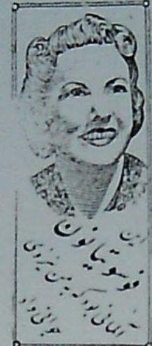
بناگاه دارویی آذر - ناسرور برای درفش کت ۱۳۸۱ ۲۱۲-۲

به از سر آمد رئیس جشن ورزش کت و ما برای این جشن از اجین تربیت بدنی دعوت عمل آوردم - توجه دارید که از آقایان به خانه و با بهترین کت نوشته است کس حاضر نشده است و کس نرسیده است جشن بر خوشان را برساند.