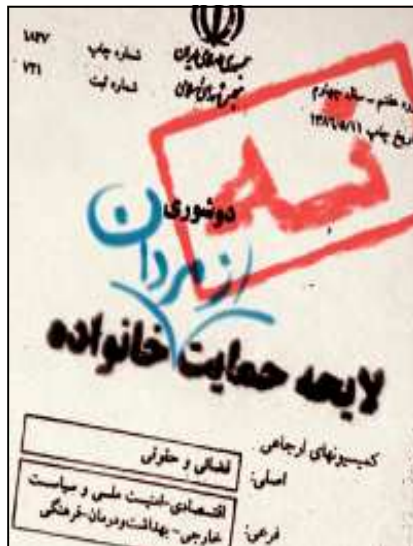
ادامه در صفحه ۲