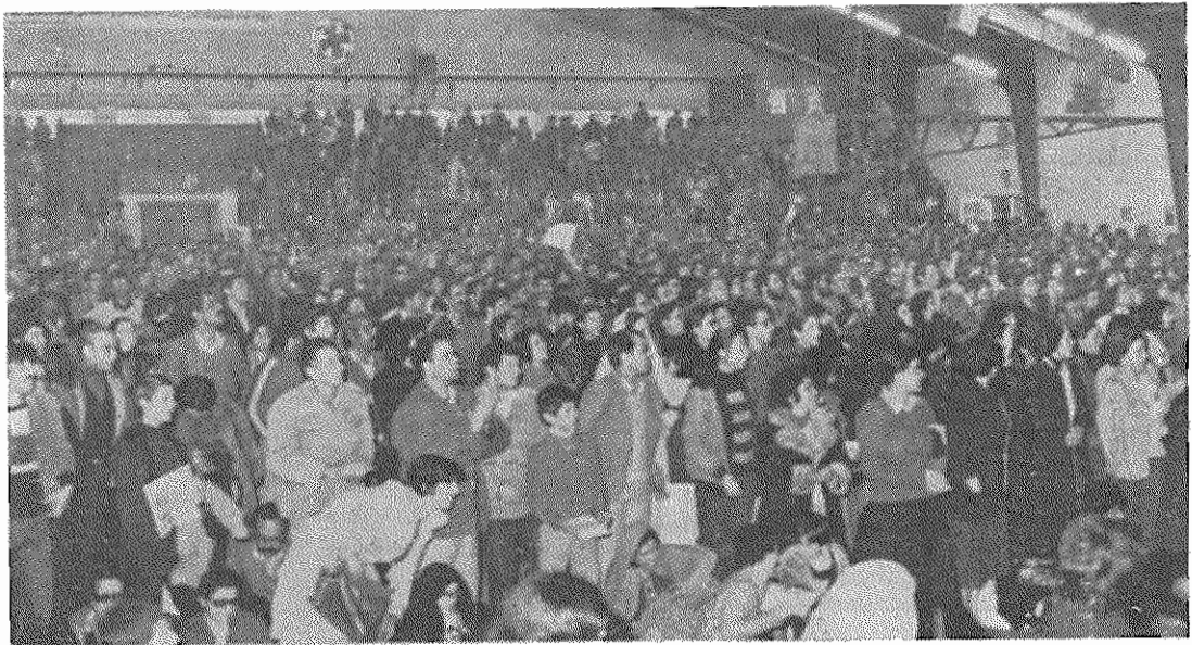
کوشه ای از مراسم ۸ مارس، روز همبستگی زنان جهان در دانشگاه صنعتی شریف