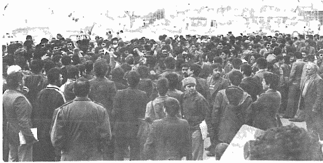
در روز یکشنبه ۱۹ اسفندماه، ساعت ۳ بعد از ظهر، تظاهراتی به پشتیبانی از دانشجویان مسلمان پیرو خط امام، بنا به دعوت جهاد سازندگی خراسان برگزار شد.

این تظاهرات در میدان شهدای مشهد برپا شد، و مردم با دادن شعارهای خمینی می‌روزم، سازشکار می‌روزم. دانشجوی خط امام، مقاومت، مقاومت، از سنگرت محافظت، محافظت. پشتیبانی خود را از دانشجویان مسلمان پیرو خط امام اعلام کردند. ولی به علت اخلاقی بعضی از عناصر ضد انقلاب که با دادن شعارهای انحرافی سعی در برهم زدن تظاهرات را داشتند، برای جلوگیری از تشنج و درگیری، ادامه تظاهرات از طرف مردم، لغو گردید.