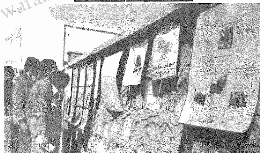
در سالگشت انقلاب شکوهمند ایران، هواداران حزب توده ایران در اهواز نمایشگاهی شامل طرح‌های ضد امپریالیستی و عکس‌هایی از جریان انقلاب تریب دادند. مردم اهواز بخصوص جوانان شهر از این نمایشگاه استقبال فراوان به عمل آوردند.

«در این حادثه» که با تاسف بسیار به خاطر گستاخ شدن روزافزون و خطرناک ضدانقلاب در این اواخر ظاهراً بایستی «طبیعی» تلقی شود، تمام کتب، نشریات و پوستره‌های مربوط به سازمان دچار حریق شد و زیان‌های مالی گزافی به سازمان وارد آمد. شدت آتش سوزی به حدی بود که قسمت‌هایی از سقف دفتر ذوب شد و پائین افتاد. در دنیا له نامه آمده است: «چنانکه مستحضر هستید، سازمان جوانان