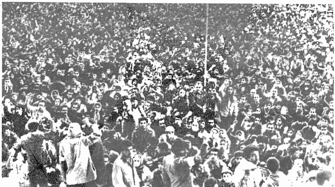
گوشه ای از گردهم آئی انتخاباتی حزب توده ایران

رزمندگان راه استقلال، آزادی و ترقی ایران برای توده ها سخن گفتند