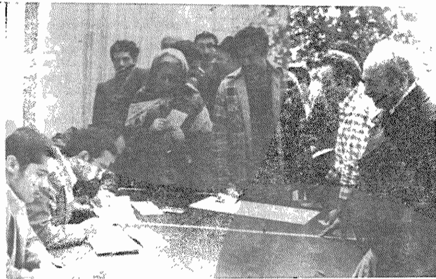
رفیق نورالدین کیانوری، دبیر اول کمیته مرکزی حزب توده ایران، در نخستین انتخابات مجلس شورایی ملی جمهوری اسلامی ایران در حوزه ۱۱۸ انتخاباتی رای میدهد.