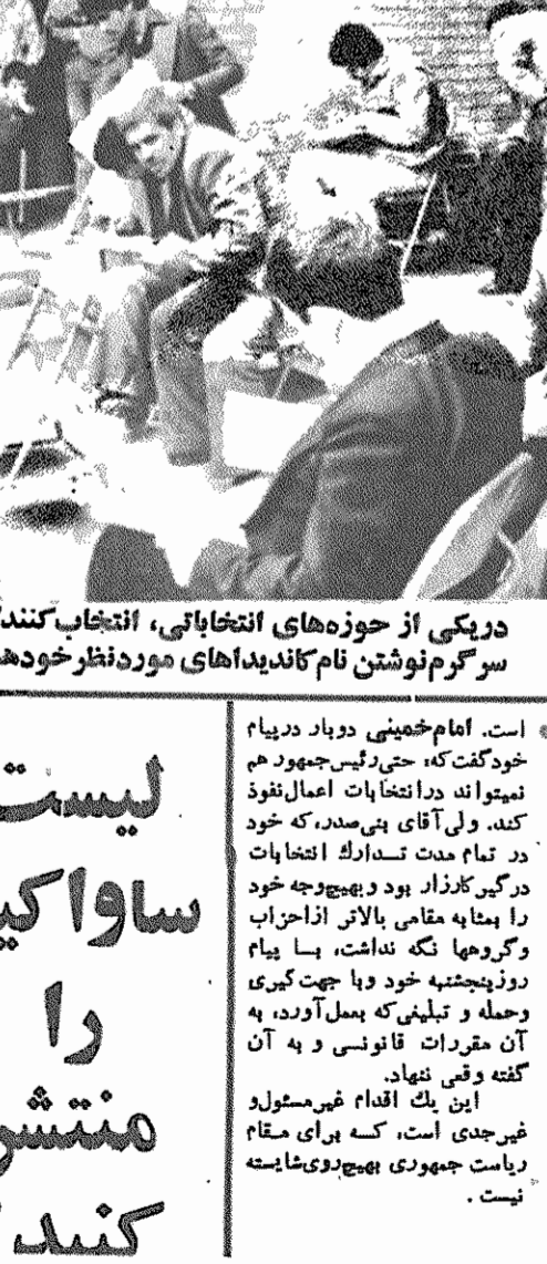
در یکی از حوزه‌های انتخاباتی، انتخاب کنندگان سرگرم نوشتن نام کاندیداهای مورد نظر خود هستند

در جریان کار کمیسیون در ایران، در هر خود به حدود وظایف کمیسیون بین المللی تحقیق نیز دوگانگی آشکاری، که ناشی از مواضع متفاوت نسبت به ماهیت و مأموریت این کمیسیون، بود، متجلی گردید. شاید در آن روزها انگیزه چنین اختلافی کملاً روشن نبود، اما امروز، پس از شکست کار کمیسیون و انتشار نظریات والد هایم دبیر کل سازمان ملل متحد و مقامات رسمی آمریکا، که تأکید میکنند آزادی گروگانها از جمله مأموریتها و وظایف این کمیسیون بوده، نیز مدعی هستند که جانب ایران هم با این مطلب توافق نموده است، انگیزه این اختلافات نظر آشکار میگردد.