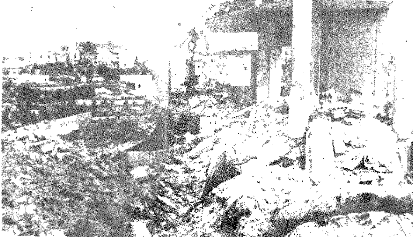
شهر دامور در ۲۵ کیلو متری بیروت، پس از بمبارانهای صهیونیستهای اسرائیلی. هیئت نمایندگی حزب توده ایران از این شهر دیدن کرد.