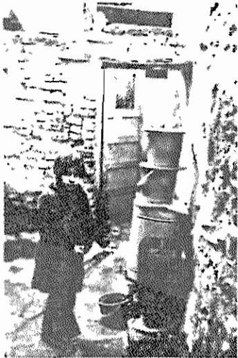
این منبع آب زنگزده مرکز تهیه آب آشامیدنی، برای بچه‌های محله است

ما قبل در اینجا زندگی میکردیم، ولی وقتی که برای ریش چاه، کف زمین فرو رفت، مجبور شدیم که به اتاق دیگری، یا بهتر بگوییم، به قفس دیگری نقل مکان کنیم و آن برای همان قفس ماهی ۵۰۰ تومان اجاره میدهم. فکرمش را بکنند، من با زن و بچه‌ام، باروزی ۹۰ تومان حقوق، چطور می‌توانیم از این زندگی با این هزینه کم‌ترکن بریم یا باور میکنید که بچه‌های هفت‌هست که لب به شویخته زنده‌اند یکی پیدا بشود و پدر دل ما برسد. هرچی باشد ما هم حق زندگی کردن داریم. این زندگی نیست که ما میکنیم، بلکه یک نوع مرگ تدریجی است.