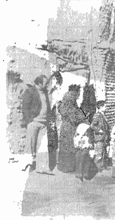
بیکاری، آلودگی‌هایی که هر آن دمکن است فرو بویزد، نداشتن آب، برق، پزشک، حمام...