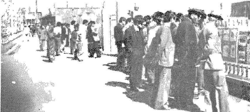
از طرف تشکلات حزب سوده ایران در اردیبهل اخیرا نمایشگاه عکس و سندی از نقش آذربایجان در جنبش خلق‌های ایران در این شهر تریب یافت. این نمایشگاه مورد استقبال پرشور زحمکشان شهر وروستا و بخصوص کسانی که با فرقه دمکرات آذربایجان آشنایی داشته و یا با آن در ارتباط بودند، فراگرفت.