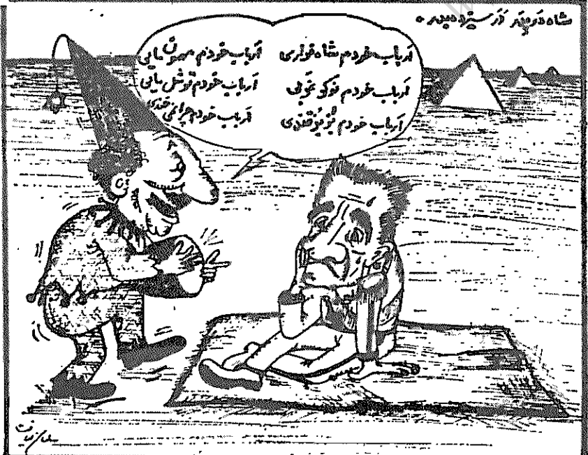
(آزادگان، ۱۶ فروردین ۱۳۵۹)

چگونه در مسیر جلوگیری از ورود انقلابیون و نمایندگان واقعی مردم به مجلس شورای ملی از هیچ جن جنم فرودگذار نمی‌نمایند و وقتی مشاهده می‌کنند که جنگه‌افروزان می‌روند تا مناطق کشور را دوباره دستخوش کنند و تفرقه سازند، چرا دردی بر نه‌باید؟