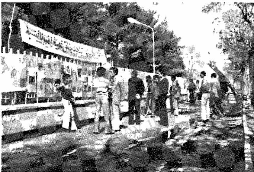
نمایشگاهی ضد امپریالیستی توسط هواداران حزب توده ایران در شهرستان نیشابور در ایام نوروزی در خیابان امام خمینی جنب باغ ملی تشکیل گردید، که مورد استقبال و بازدید وسیع مردم شهر قرار گرفت.