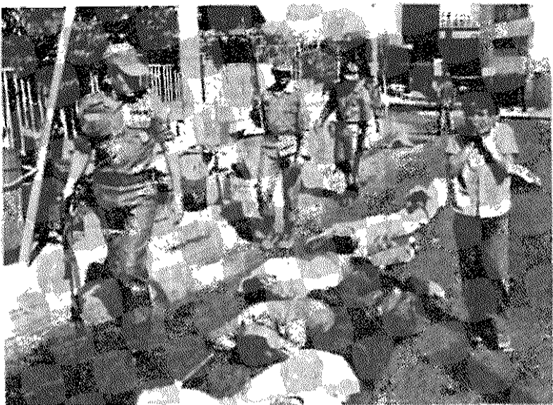
امپریالیستهای آمریکایی بکمک دست نشاندهگان خود، خلق آزاده ال سالوادور را به اسارت در آورده‌اند

ملی و در چارچوب «کمیته هماهنگی انقلابی-ملی» متحد شد. ائتلاف هم‌زمان مهم‌ترین احزاب چپ و سازمانهای خلقی در «کمیته هماهنگی انقلابی توده‌ها» گامی دیگر در راه نیل به وحدت عمل همه نیروهای مخالف رژیم بود. این کمیته چندی پیش برنامه خود را برای درهم شکستن دستگاه قدرت الیکارشی حاکم و تشکیل یک دولت دمکراتیک انقلابی اعلام داشت. حزب کمونیست ال سالوادور در آستانه پانجاهمین سالگرد بنیان‌گذاری خود در ۱۵ مه ۱۹۳۱ میلادی و در کنار مبارزات خود برای برپا کردن حکومتی دموکراتیک و ملی، در پی مبارزه در برابر استعمار و وابستگی ال سالوادور به امپریالیسم آمریکایی و خنثی کردن نفوذ آن کشور در منطقه است.