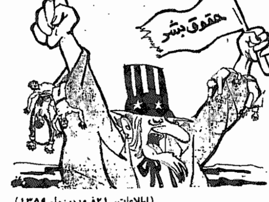
(مجاهد، ۲۱ فروردین)