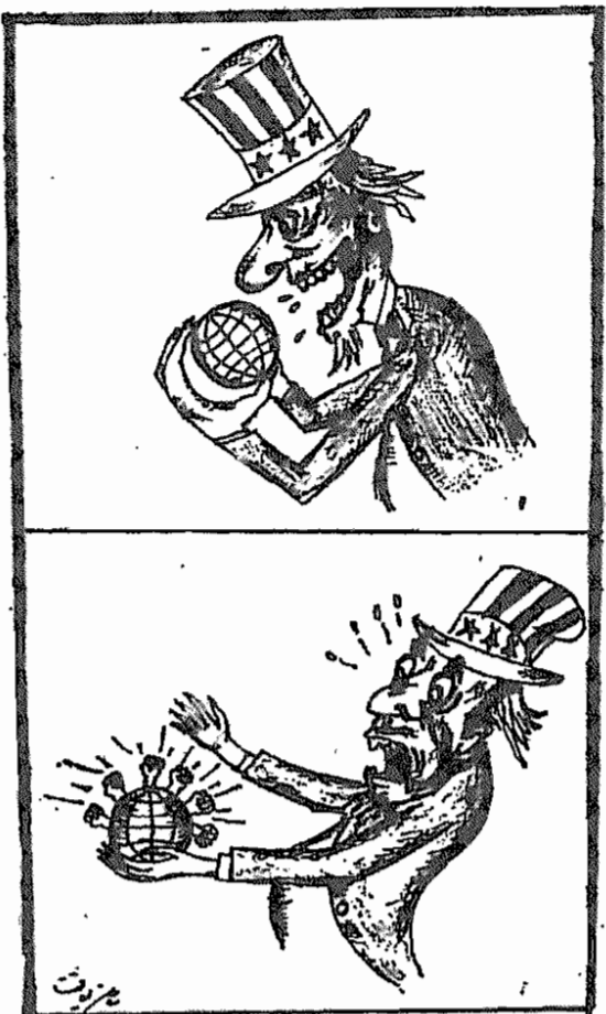
(صبح آزادگان، ۲۳ فروردین ماه ۱۳۵۹)

مردم به انقلاب ایران امیدها بسته بودند، مردم در انقلاب ایران عزت و شرف گمشده خود را می جستند و در کنار آن گذرانی آرام و آشفته به عدالت را می خواستند. راست است که انقلاب اسلامی ملت ایران آزادی و استقلال ایران را فراهم آورد. و راست است که انقلاب نظام سلطه را از سرزمین ایران برچید، و راست است که در جهت از میان بردن استعمار تسمیم های شایسته ای گرفته شده است، و راست است که جهت گیری سیاسی انقلاب نوسید بخش رفاه و عدالت است. ولی نظام حکومتی که مسئول اجرای خواسته های انقلابی مردم است، توانائی لازم را از خود نشان نداده است. مردم ایران آزرده از نارسائی و تباهی نظام حکومتی گذشته، چشم بد راه آن بودند که حکومت در نظام جمهوری اسلامی توانائی رسالت لازم را داشته باشد، مردم ایران، رنجیده از هدفها و روشهای نظام حکومتی گذشته، می خواستند که پس از انقلاب روشها و مبارزات انسانی و سازنده به ایشان عرضه دارند. ولی انتظارات مردم از بروز تحول در نظام حکومتی ناکام ماند. نارسائیها و تباهیها از نظام حکومتی ایران زود زود شده، سلامت و توانائی در نظام حکومتی ایران دیده نداشت. نظام حکومتی نو.