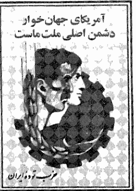
آمریکای جهان خوار دشمن اصلی ملت ما است