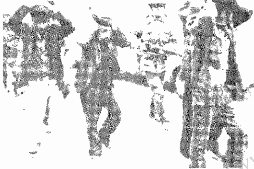
ترکیه - ۱۹۷۸