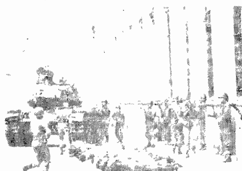
شیلی - ۱۹۷۳

زرژمارشه، دبیر کل حزب کمونیست فرانسه، در کنفرانس مطبوعاتی که در روز اول اسفند ۱۳۵۸ در ساختمان پارلمان فرانسه ترتیب داده شده بود، تاسیس کمیته‌ای را بنام «کمیته دفاع از آزادیها و حقوق بشر در فرانسه و جهان» اعلام کرد. بگفته زرژمارشه، که ریاست کمیته نامبرده را بعهده گرفته است، این کمیته و خلیفه‌داران تابا افشاگرهای خود مبارزه کمونیست‌ها را در راه ایفای حقوق بشر و علیه نقض آنها در فرانسه و نقاط دیگر جهان به‌سختی بی‌همتای ارتقا بخشد. زرژمارشه در بخشی از سخنرانی خود گفت: