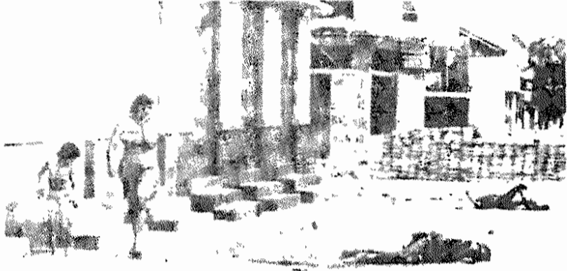
نیکاراگوئه - ۱۹۷۸