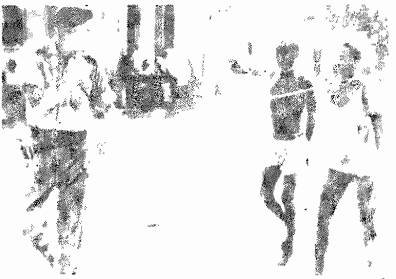
کنگو - ۱۹۶۵