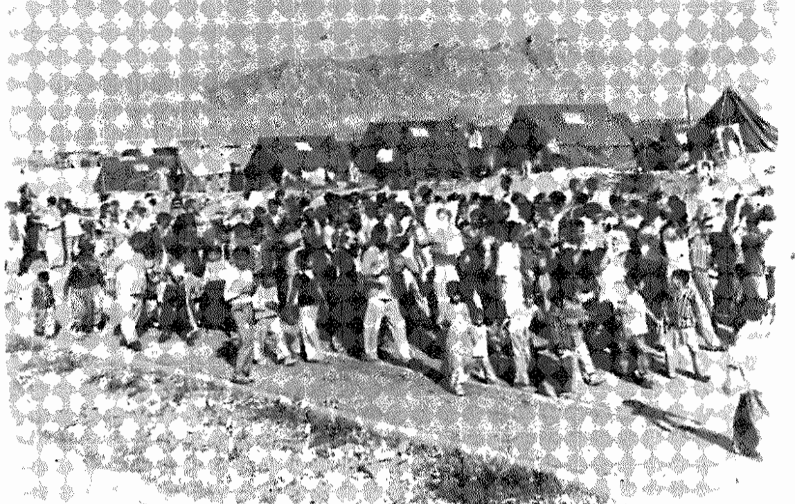
اردوگاه ایرانیان رانده شده از عراق - گروه تازه ای بطرف چادرها میروند.

جوانان ۱۸ تا ۲۲ ساله را مأموران عراقی دستگیر میکنند، زنها، کودکان خردسال، پیرزنها و پسران را رانده شده گان ساعتها تشنه و گرسنه زیر آفتاب سوزان پیاده طی می کنند، تا به مرز ایران برسند. کودکان خردسال وقتی به مرز میروند، از شدت تشنگی بیهوش شده اند.